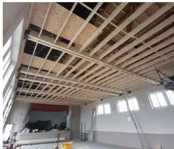
Rénovation de la charpente de la maison communale