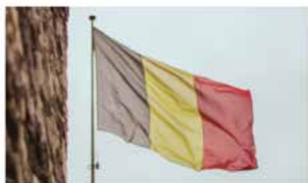
Commémoration 8 mai 1945

Commémoration Goûter des aînés Les as du climat