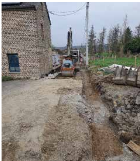
Début des travaux de rénovation de l'Impasse des Merles à Faulx-Les Tombes