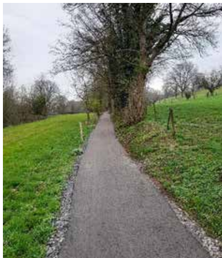
Poursuite de l'aménagement du ViciGAL à Gesves