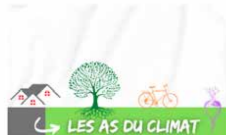
LES AS DU CLIMAT Défi mobilité : samedi 20 avril 2024 Soirée de clôture : vendredi 31 mai 2024