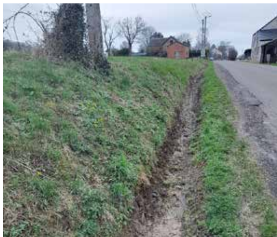
Curage des fossés le long des routes communales