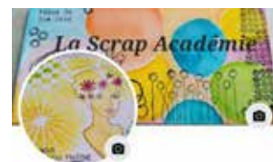
La Scrap Académie @la.scrap.academie 379 amîyès