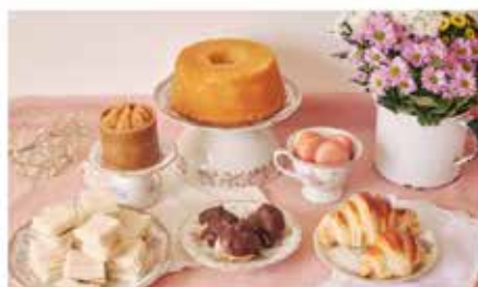
Goûter des aînés Jeudi 30 mai 2024