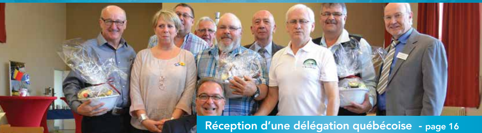
Réception d'une délégation québécoise - page 16