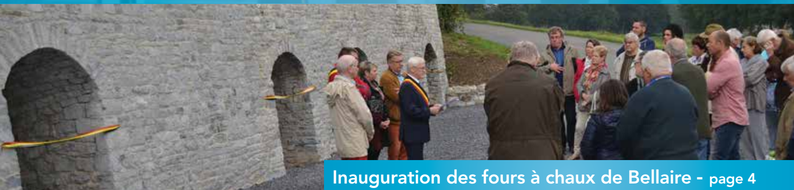
Inauguration des fours à chaux de Bellaire - page 4