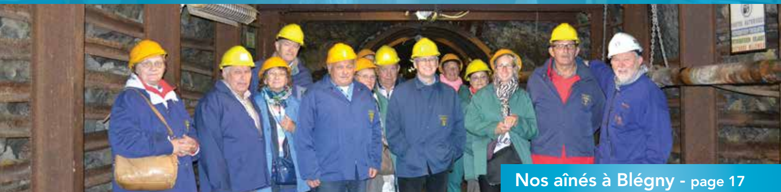
Nos aînés à Blégny - page 17