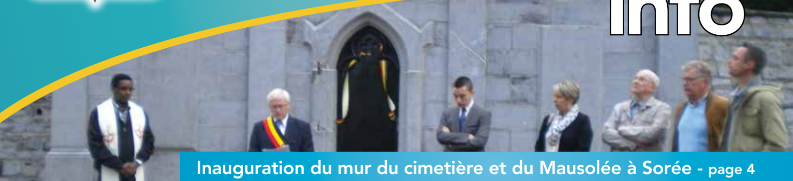
Inauguration du mur du cimetière et du Mausolée à Sorée - page 4