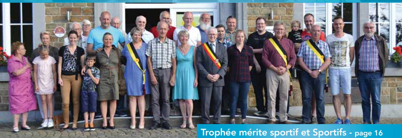
Trophée mérite sportif et Sportifs - page 16