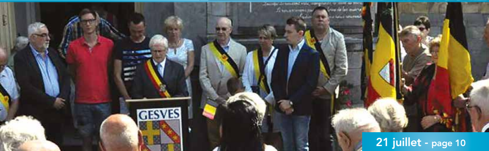
21 juillet - page 10