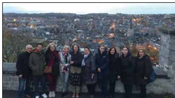
Nos partenaires lors de la préparation du projet à la citadelle de Namur.

Chaque établissement s'engage à approfondir le thème à travers des expériences, des activités d'éveil, des visites etc. On pourra par la suite échanger, partager et enrichir nos possibilités. L'objectif étant de mettre en évidence le plus de solutions possibles en tant que citoyens de notre planète. Chacun pourra donc s'inspirer de ce que chaque culture a à apporter. Ce projet durera deux années scolaires (2018-2020).