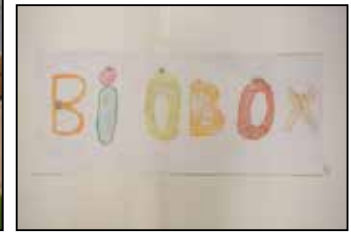
Réalisation des élèves de P3-P4