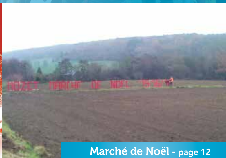
Marché de Noël - page 12