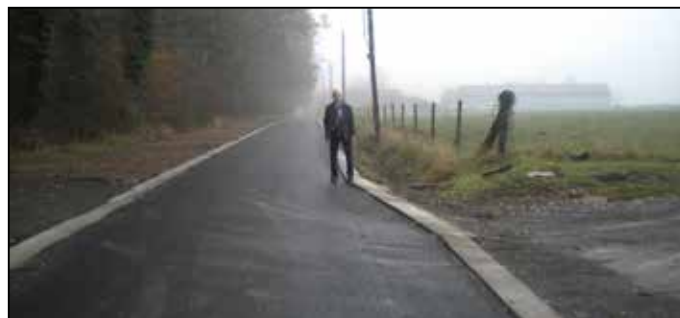
Rue du Chaumont – Vivier Traine Il était temps !