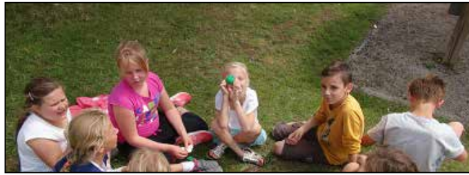
L'ATL est un des 3 milieux de vie de l'enfant, aux côtés de la famille et l'école

Un décret de la Communauté française balise ce secteur depuis 2004. La commune de Gesves y est entrée depuis le 16 mars 2007.