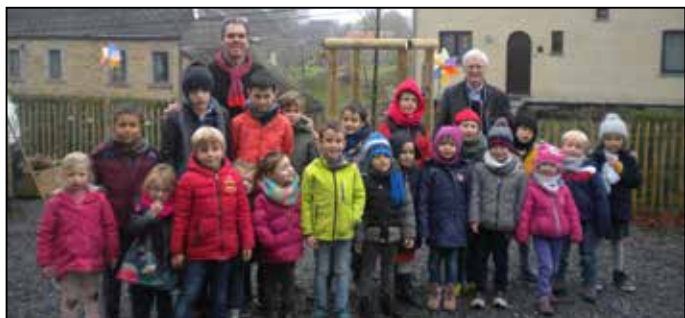
Ecole communale de la Croisette (SOREE) - Commémoration du Centenaire 14-18 par la plantation de l'arbre de la PAIX.