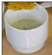
velouté de fane de chou-fleur avec sa tuile

Au menu de ce samedi midi : velouté de fane de chou-fleur à la tresse di fou et sa tuile crackers de courge, dés de fromage au sel de céleri maison, lit de pied de brocoli à la foucade et aux noix, pizza bolognaise courge et brocoli, gâteau aux pommes et sirop de trognon et pépins de pomme !