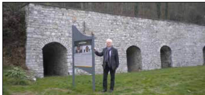
Les Fours à Chaux à Haltinne Panneau didactique en français et en wallon