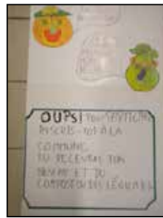
Réalisation des élèves de maternelle

C'est au tour des enfants de Gesves Extra de réaliser la mise en peinture des panneaux d'informations qui seront apposés sur les Biobox !