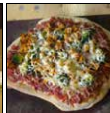
et la pizza ! Hum !

Grand merci Edwige pour tous ces trucs et astuces !