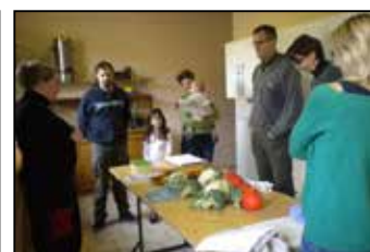
Un peu de théorie également ...