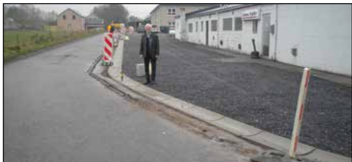
Le football de Gesves – Au fil de l'eau Rue de la Pichelotte