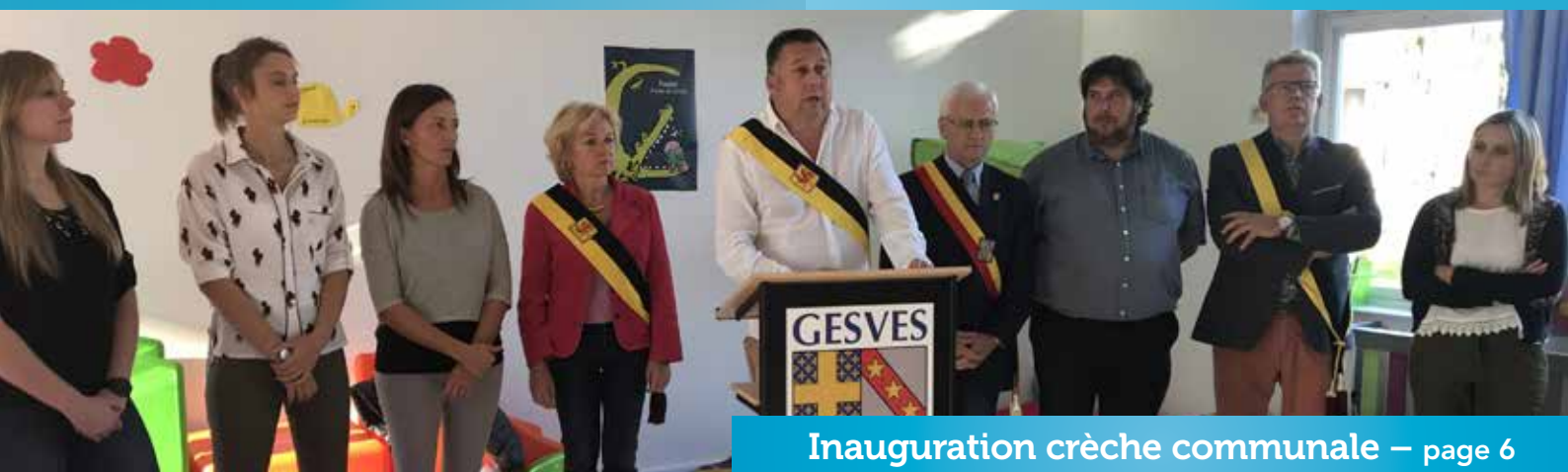
Inauguration crèche communale – page 6