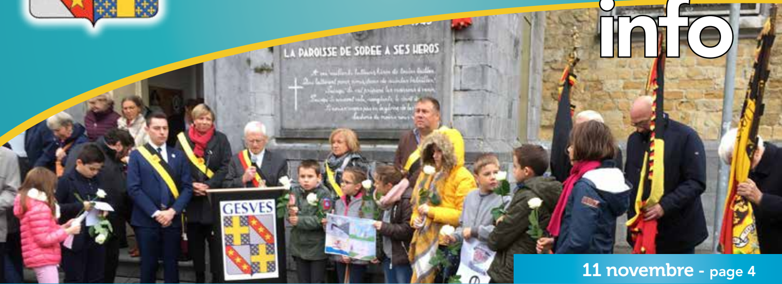
11 novembre - page 4