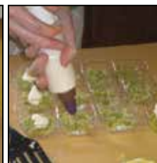
lit de pied de brocoli