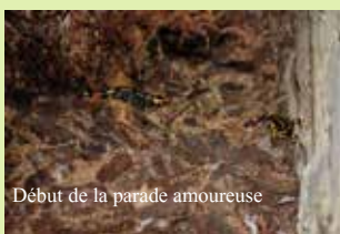
Début de la parade amoureuse

Les larves se nourrissent de daphnies, de tubifex, de petits insectes aquatiques, quittent l'eau après quelques mois, et gagnent les bois. Elles sont adultes à 2 ans.