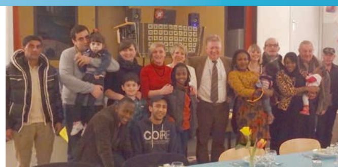
Vœux avec les réfugiés Page 19