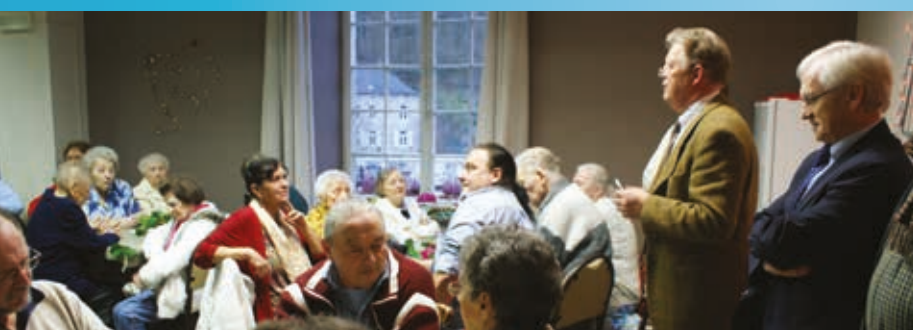
Noël au Foyer Saint-Antoine Page 20