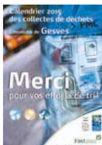
Tableau des collectes GESVES 2015

Si vous le souhaitez, vous pouvez télécharger ce calendrier sur le site Internet du BEP Environnement ou encore télécharger l'application RECYCLE ! sur votre tablette et/ou smartphone.