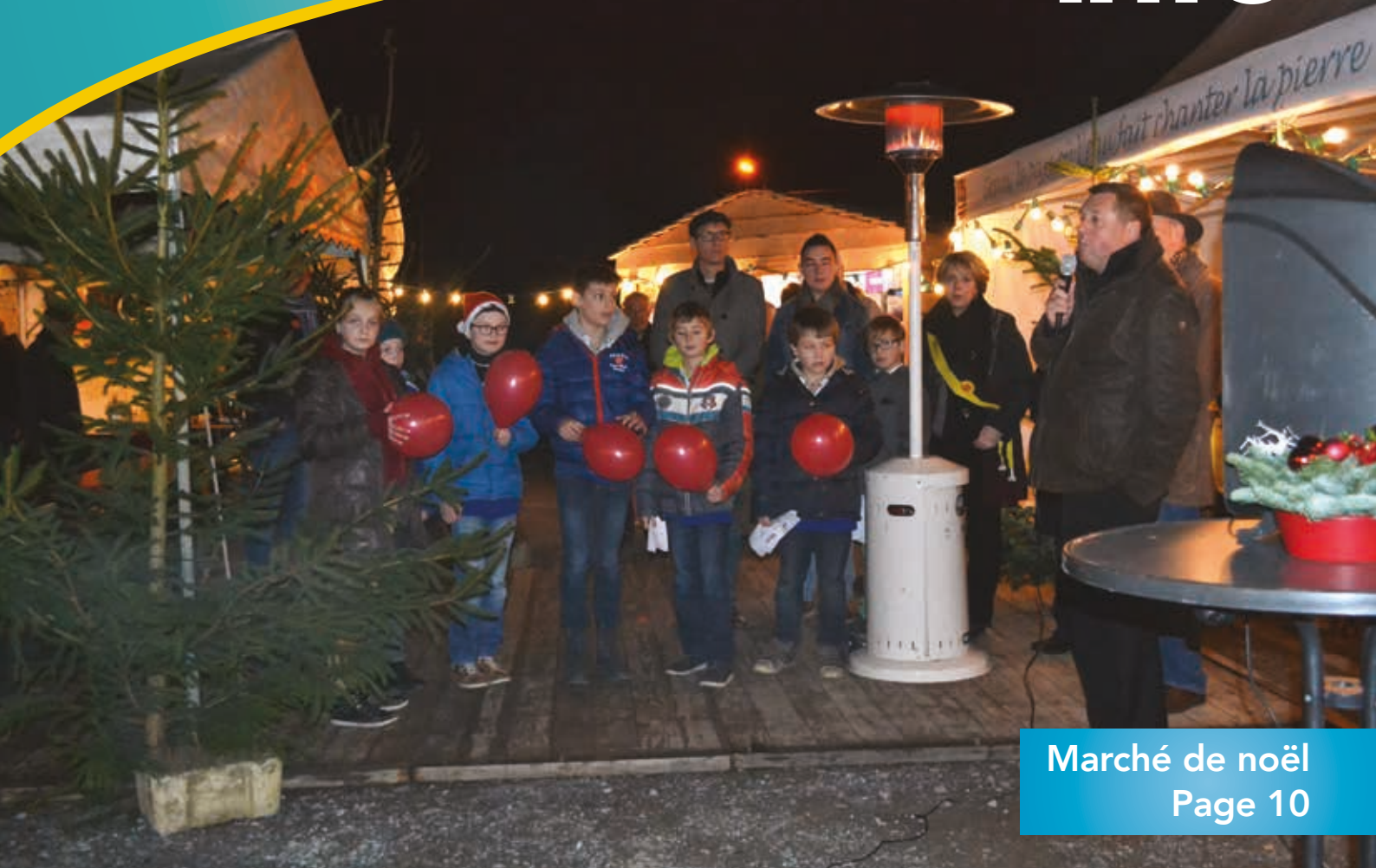
Marché de Noël Page 10